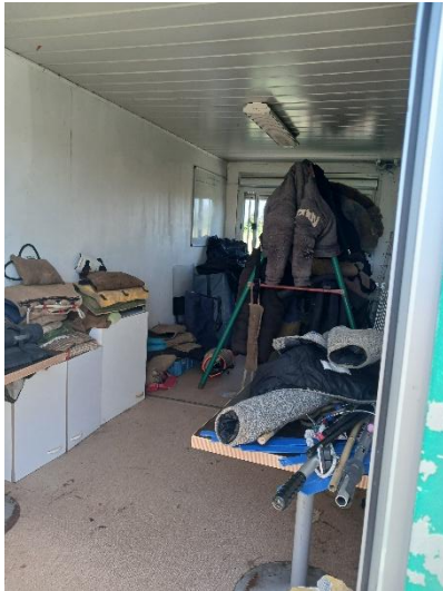
Divers costumes de mordant et de déconditionnement