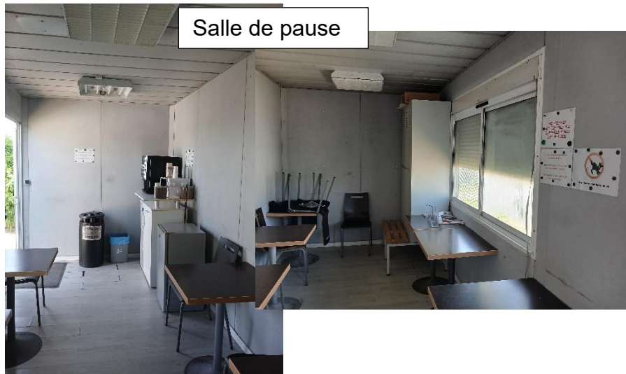
Salle de pause